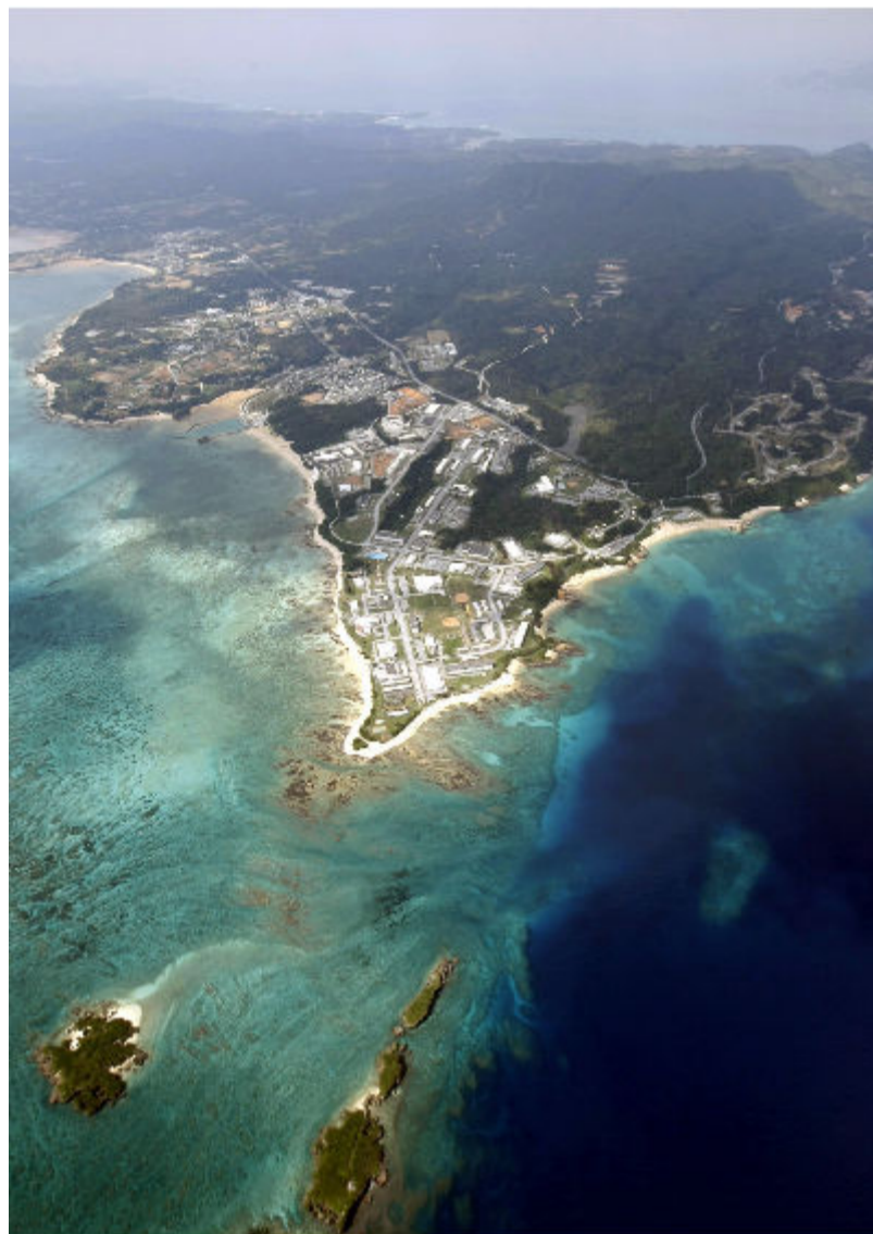
普天間飛行場移設予定地

される。 外務、防衛担当閣僚による次回の日米安全保障協議委員会（2プラス2）までに移設計画を策定すると明示。国連総会が開かれる9月を想定している。これに向け、8月までに日米の専門家で工法など技術的側面について基本合意を目指す。 声明には普天間代替施設を念頭に、自衛隊との共同使用の検討も盛り込んだ。